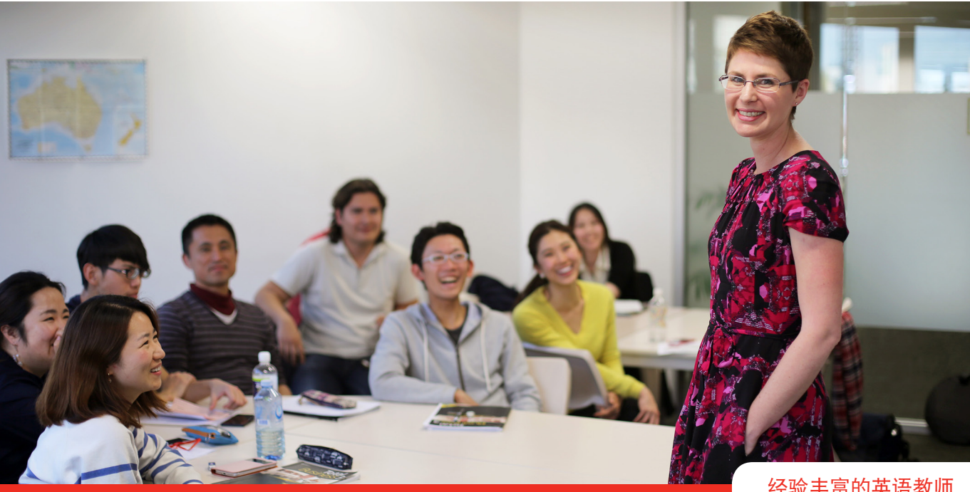
经验丰富的英语教师